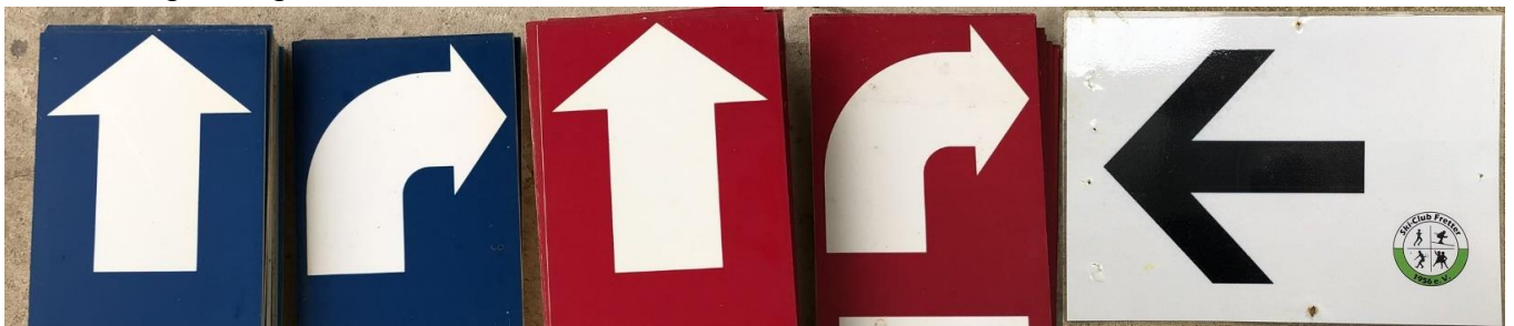
10,5 km (blau)

Streckenmarkierung : rote Signierfarbe auf Boden sowie rote (20 km) und blaue (10,5 km) Schilder mit Pfeilen + schwarze, einlaminierte Pfeile in Augenhöhe / KM-Schilder nur auf der 20 km Runde bei 5/10/15. Ansonsten gilt: immer geradeaus auf dem Hauptweg bleiben außer die Markierungen sagen etwas anderes.